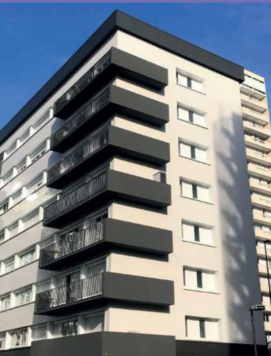
Residence Emmaüs Habitat rue Victor Hugo rénovée en 2019

L'urbanisme est le fer de lance pour développer harmonieusement un territoire, attirer des entreprises et garantir une qualité architecturale des constructions. Au cours des six dernières années, tout a été mis en œuvre pour fortifier cette philosophie. De plus, une attention toute particulière a été portée à la réhabilitation du parc privé mais également des résidences sociales.