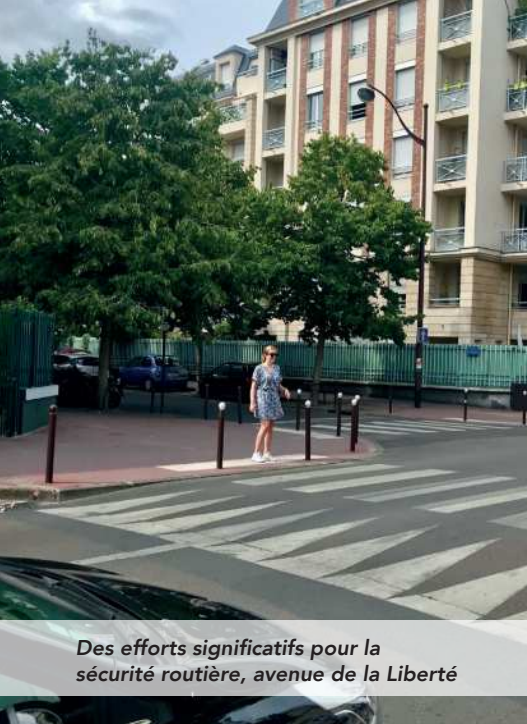
Des efforts significatifs pour la sécurité routière, avenue de la Liberté