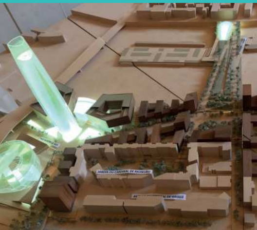
Charenton-Bercy Le Grand Paris Commence Ici

Depuis sa prise de fonction en 2016, le Maire a déployé de multiples initiatives pour améliorer le cadre de vie des quartiers situés sur la partie sud. L'opération de renouvellement urbain Charenton-Bercy rayonne au niveau régional. Elle va permettre l'émergence d'un éco-quartier et de nouvelles liaisons avec Paris. De plus, des actions sont menées, avec l'Etat, pour traiter l'autoroute A4 afin de la pacifier. Enfin, la Ville a octroyé des garanties d'emprunt aux bailleurs sociaux pour améliorer leurs immeubles en termes de rénovation énergétique et de sécurité.