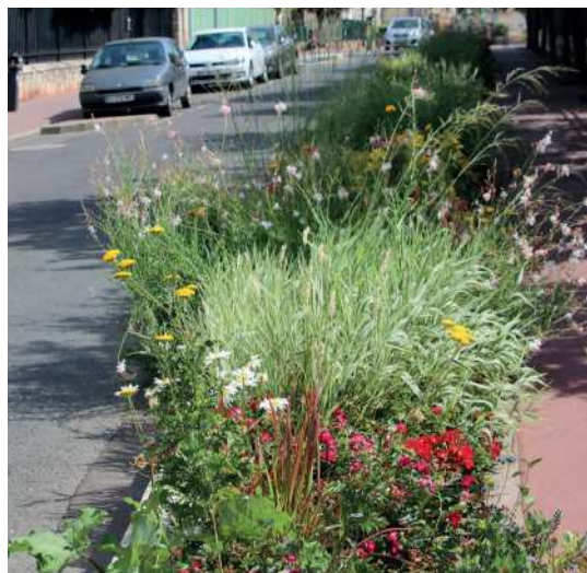
Renforcement de la nature en ville