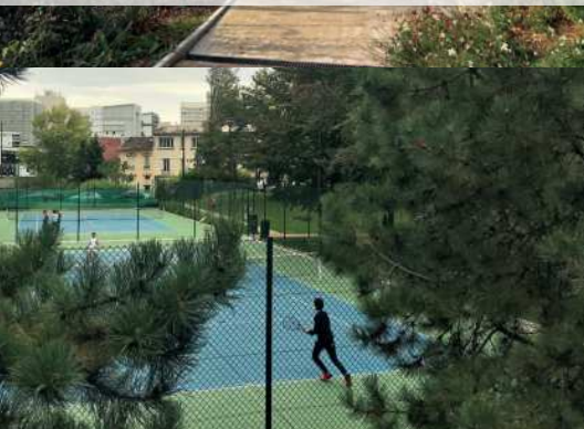
Square Jean Mermoz rénové

handicapées de Charenton. En parallèle, des permanences de cet organisme sont organisées, chaque semaine, au Centre Alexandre Portier.