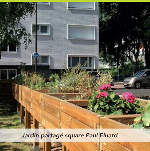
Jardin partagé square Paul Eluard

Faire de Charenton, une ville où la nature est plus présente, pour la rendre plus agréable encore, plus verte, est au cœur de nos diverses politiques municipales. Il s'agit également de développer les opérations favorisant les économies d'énergie et les nouvelles mobilités. Pour relever ce défi, la collectivité sensibilise ses concitoyens notamment les plus jeunes.