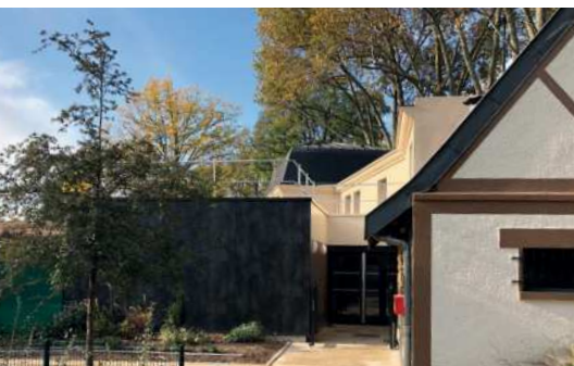
Multi accueil Simone Veil