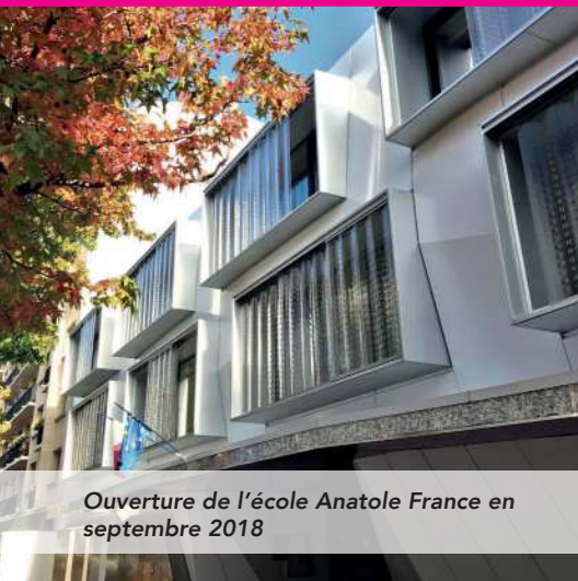
Ouverture de l'école Anatole France en septembre 2018

Charenton se transforme à travers ses grands projets et des améliorations quotidiennes répondant aux défis de notre époque. Toujours dans le respect des marges financières de la ville, chaque quartier a été concerné au cours des dernières années par la création de nouveaux équipements et la mise en place de services.