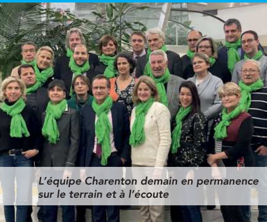
L'équipe Charenton demain en permanence sur le terrain et à l'écoute