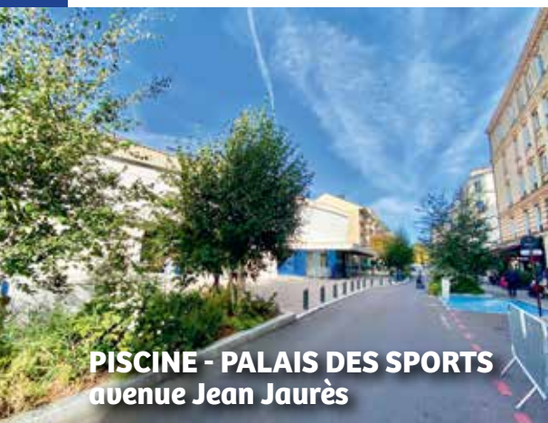
PISCINE - PALAIS DES SPORTS avenue Jean Jaurès