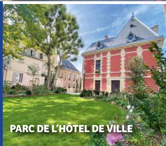
PARC DE L'HÔTEL DE VILLE