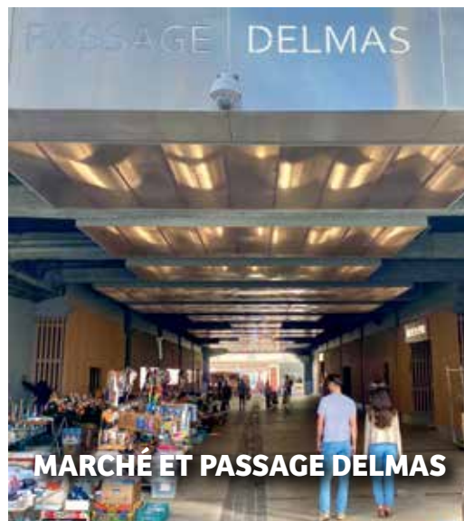
MARCHÉ ET PASSAGE DELMAS