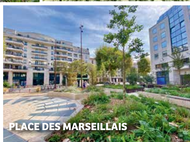
PLACE DES MARSEILLAIS