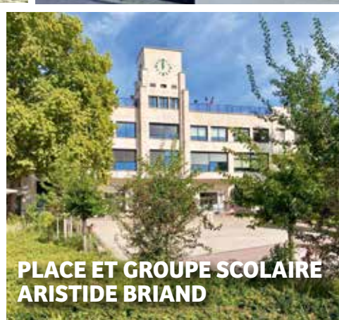
PLACE ET GROUPE SCOLAIRE ARISTIDE BRIAND