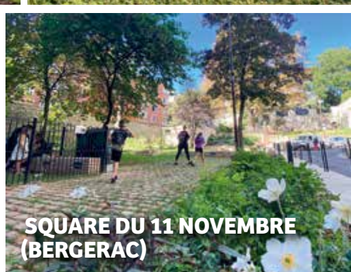
SQUARE DU 11 NOVEMBRE (BERGERAC)