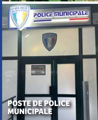
POSTE DE POLICE MUNICIPALE