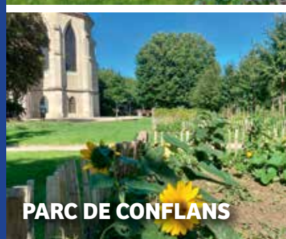
PARC DE CONFLANS