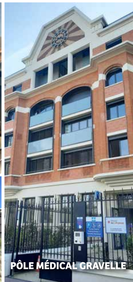
PÔLE MÉDICAL GRAVELLE